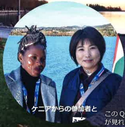
ケニアからの参加者と