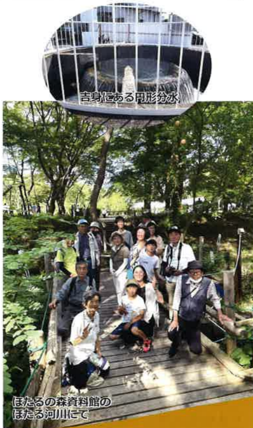
吉身にある用排水路

近年は農作業を身近にみる機会の少ない青少年が増えているので、小学生や中学生だけでなく、高校生や大学生に対しても、用排水路の観察時には水田と水路の関係やそこで観察される堰などの施設についての説明が必要ですが、今回の参加者は半数以上が年配の方であったため、その必要はありませんでした。むしろ、参加者が若い時を振り返って往時の水を取りまく環境と現在の違いについて、各々の体験を語っておられたのが印象的でした。