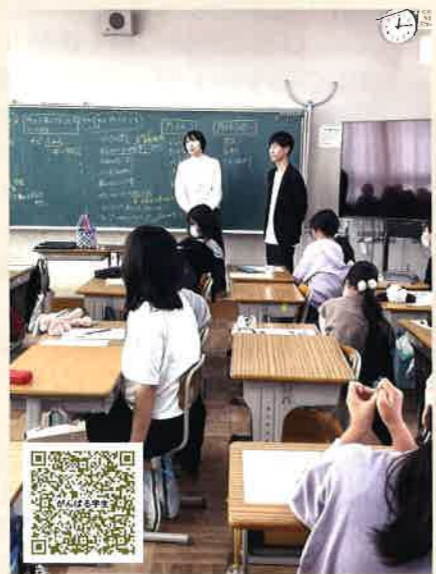
↑この QR コードを読むと動画が見れます

が今後の 2 人の役に立つならこれほど嬉しいことはありません。お疲れさまでした。