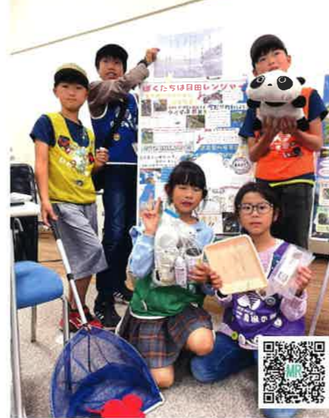
↑このQRコードを読むと動画が見れます

川や琵琶湖の生きものたちを守るため、びわこ豊穰の郷で活動する「目田レンジャー」が、日頃の活動を紹介するフォーラムポスターを使って発表し、16団体の中から準グランプリを受賞しました。そのほか、フォーラム来場者から最も多くの応援コメントをいただいた「応援の花さいたで賞」も受賞しました。現在目田レンジャーのエースチームは、2023年淡海こどもエコクラブ壁新聞コンクールにも出展し、12月3日に琵琶湖博物館で開催される交流会発表に向けて練習に精を出しています。目田川を守るためレンジャーそれぞれが気になるテーマを調べて発表します。