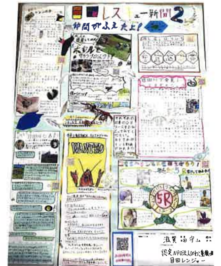
壁新聞コンクール出展作品

川や琵琶湖の生きものたちを守るため、びわこ豊穰の郷で活動する「目田レンジャー」が、日頃の活動を紹介するフォーラムポスターを使って発表し、16団体の中から準グランプリを受賞しました。そのほか、フォーラム来場者から最も多くの応援コメントをいただいた「応援の花さいたで賞」も受賞しました。現在目田レンジャーのエースチームは、2023年淡海こどもエコクラブ壁新聞コンクールにも出展し、12月3日に琵琶湖博物館で開催される交流会発表に向けて練習に精を出しています。目田川を守るためレンジャーそれぞれが気になるテーマを調べて発表します。